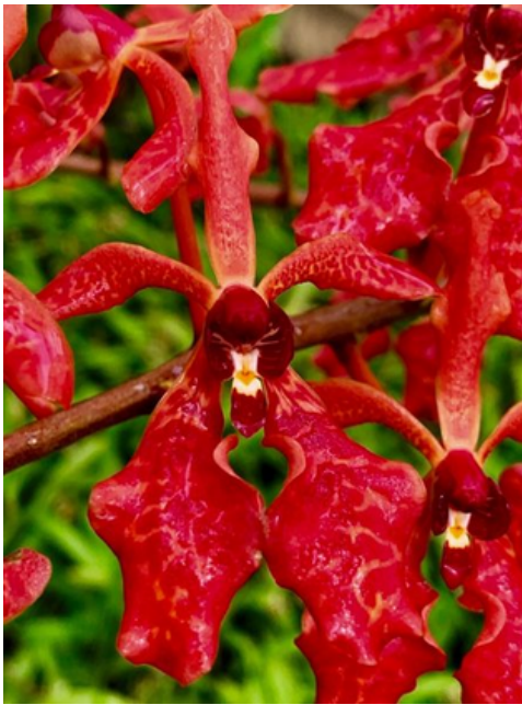
DAS IST EINE ORCHIDEE. SIE HAT DEN NAMEN „RENANTHERA“.